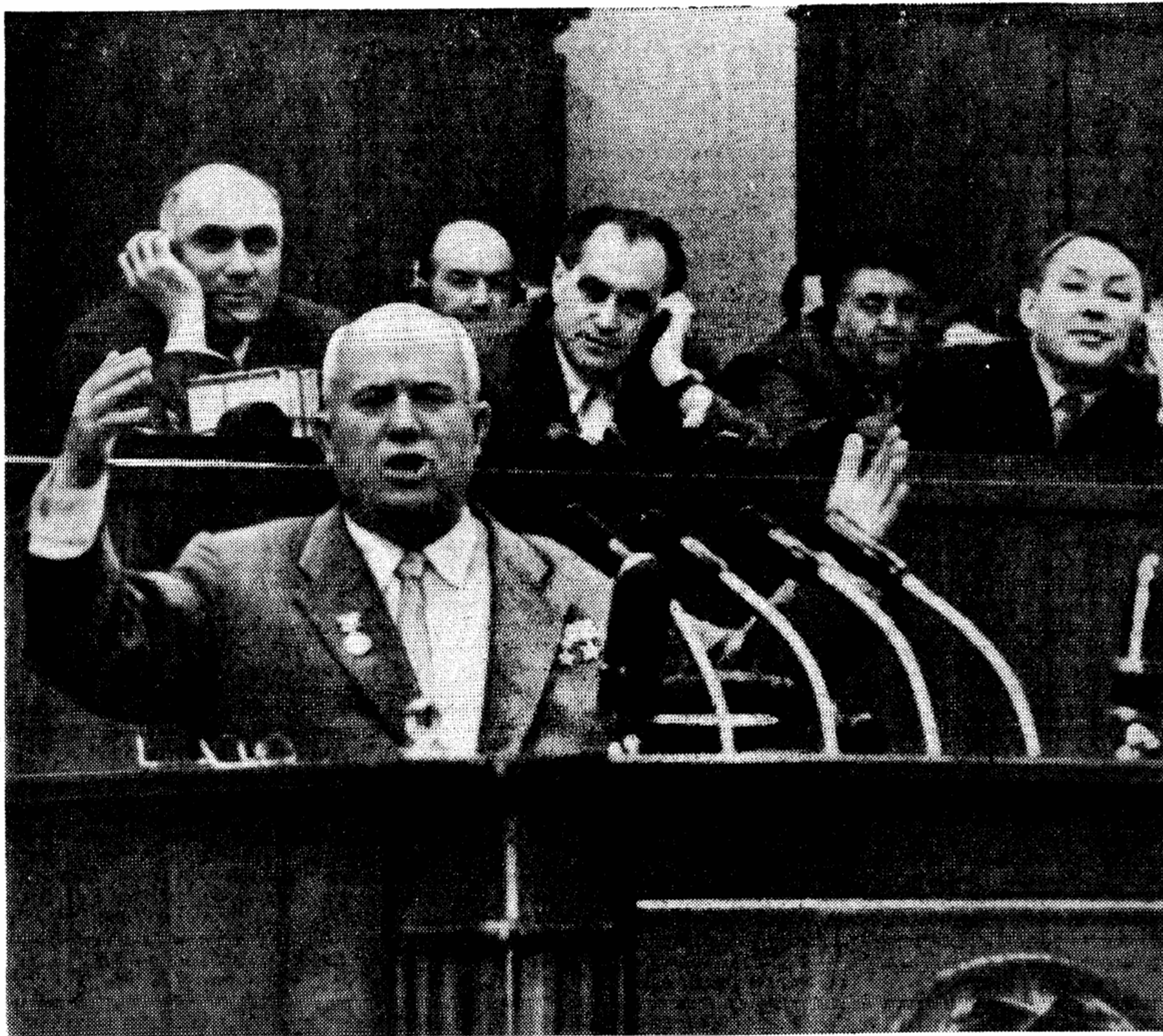
Никита Сергеевич Хрущев выступает с речью на Третьем съезде писателей СССР 22 мая 1959 года в Большом Кремлевском дворце.