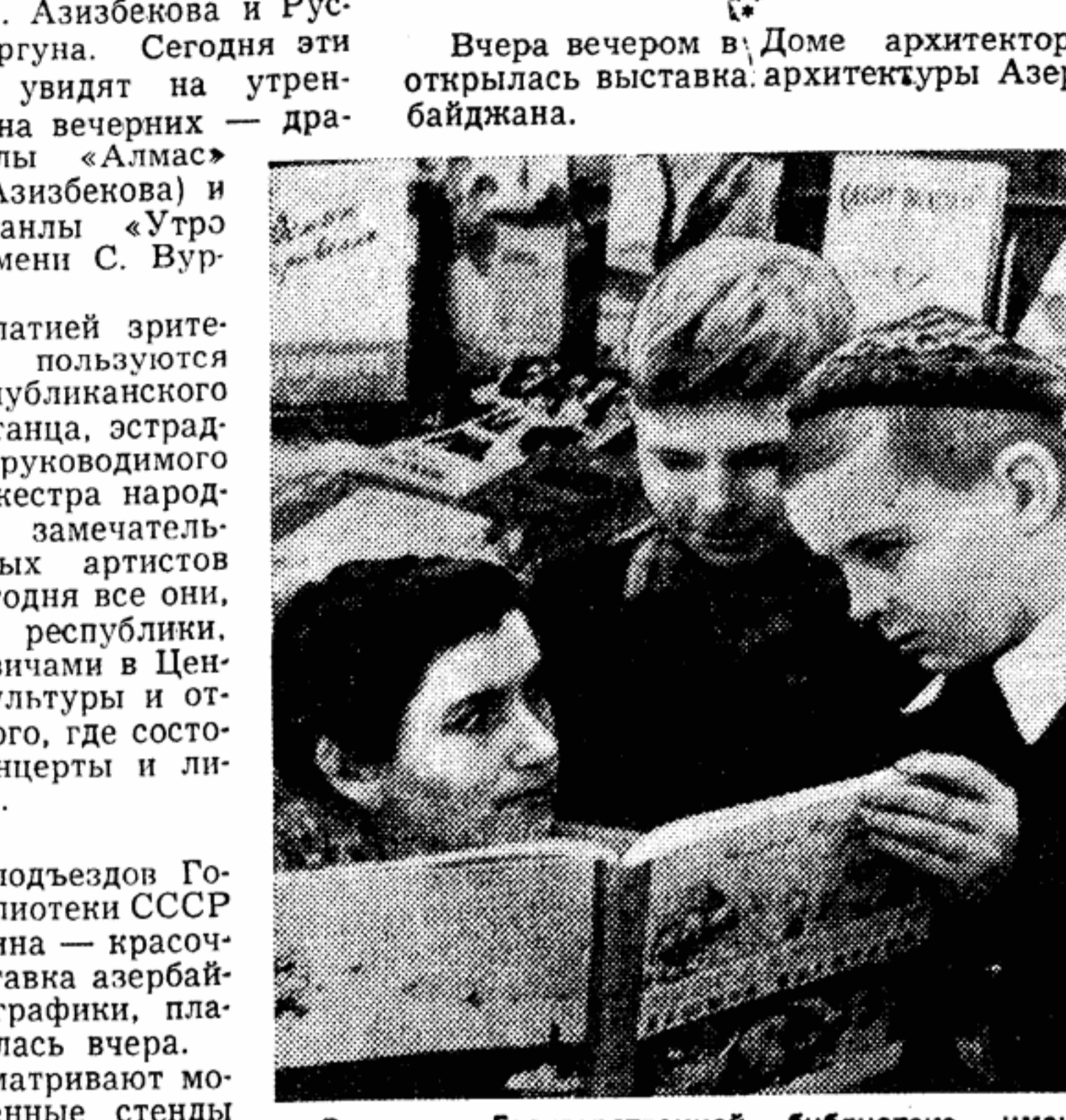
Вчера в Государственной библиотеке имени В. И. Ленина открылась выставка книг, графики и плаката Азербайджана...